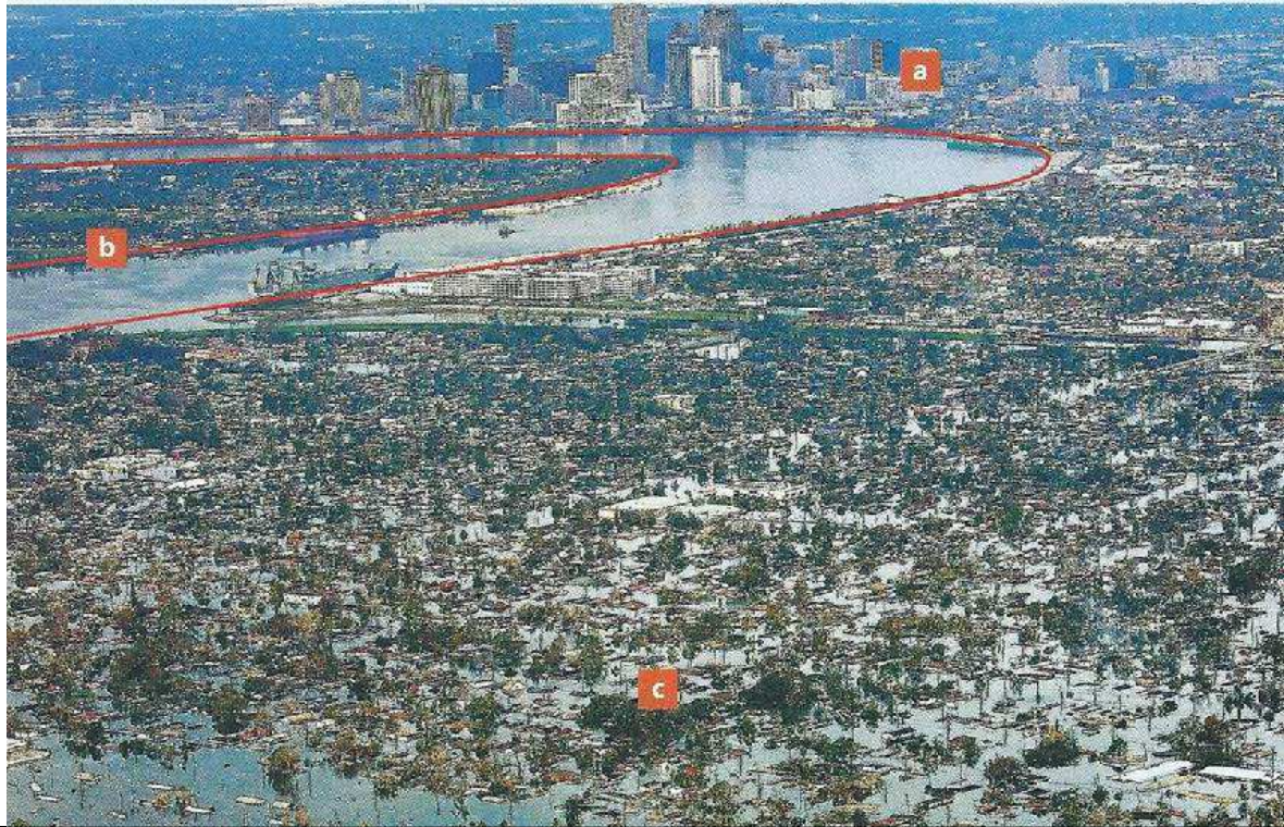
A : Quartier des Affaires, B : Dignes du Mississippi, C : Zone inondée

Document 1 : Dégâts causés par le passage du cyclone Katrina Lors du passage de Katrina, les digues protégeant la ville de la mer et des eaux du lac Ponchartrain cèdent, inondant 80% de la ville et causant 1800 morts, des centaines de milliers de sans-abris et entre 100 et 300 milliards de dollars de dégâts.