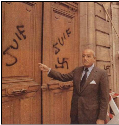
Inscription sur la porte de l'adjoint au maire de Paris, 1998

1 - Comment appelle-t-on le type d'inscription retrouvé sur cette porte ?