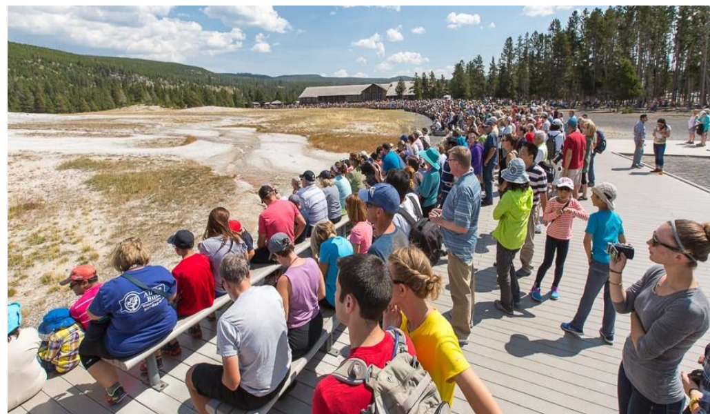
Visiteurs attendant devant le geyser Old Faithful durant l'été 2016

Les défis posés par cette forte augmentation de la fréquentation, notamment estivale, et par l'évolution des pratiques des visiteurs poussent les acteurs du parc à étudier de futures stratégies de gestion des flux s'appuyant sur la communication, la gestion du trafic routier avec des systèmes de navettes ou d'autres transports alternatifs ainsi que des systèmes de réservation (entrée dans le parc, parking) ou de limitation de durée sur place. A l'été 2019, une grande étude sera menée auprès des visiteurs pour sonder leurs préférences parmi ces propositions.