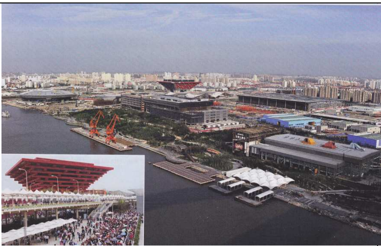
Document 1 : Le parc de l'exposition universelle de Shanghai (2010)

Son poids économique 20% du PIB 30% du commerce extérieur 50% des investissements étrangers Ses capacités portuaires 34% du volume des conteneurs 43% du fret national 35% du charbon transporté 48% du pétrole brut 55% des minerais métalliques