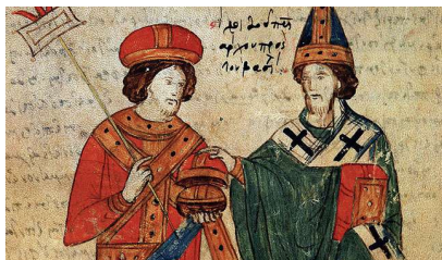
Léon IX et Michel Cérulaire, miniature grecque, XV e siècle, Bibliothèque nationale. Palerme.

D'après les Ecrits concernant le schisme entre les Eglises grecque et latine , IX e siècle, archive du Vatican, Rome.