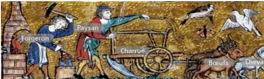
3 Brunet Latin, Livre du trésor, et autres traités , France (Valenciennes) Angleterre, vers 1326 - Paris, BnF, département des Manuscrits, Français 571, fol. 66v.