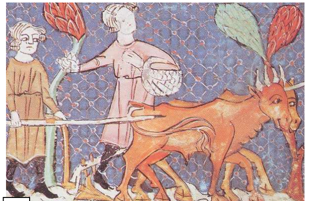
4 L'ancêtre de la charrue : l'araire Miniature, Bibliothèque royale d'Espagne, XII e siècle.